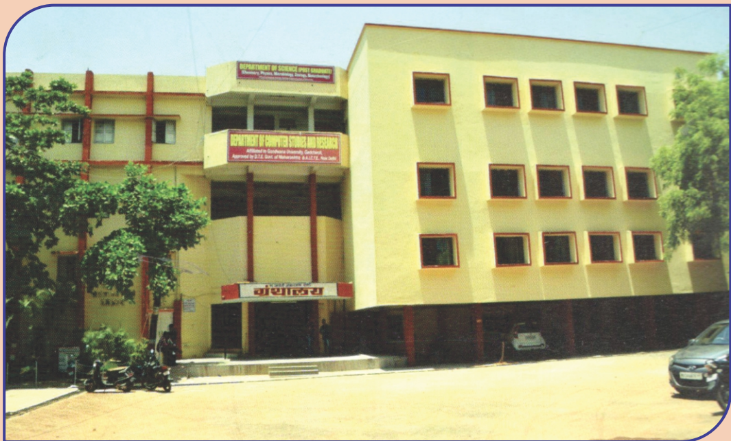
Department of Computer Studies & Research